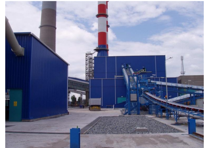
”Lime Store Handling” für Rauchgasentschwefelungsanlage Maritza Iztok III