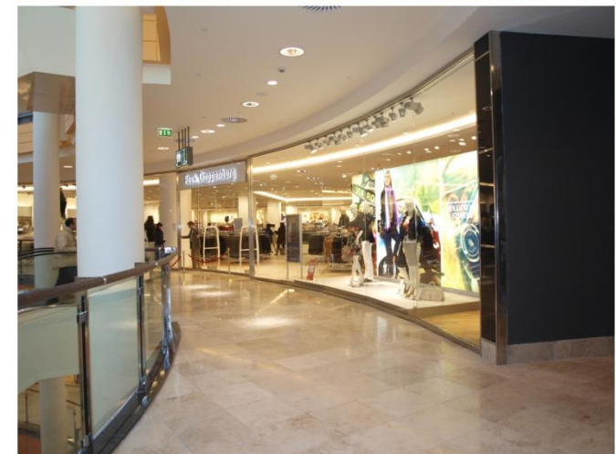
Peek & Cloppenburg