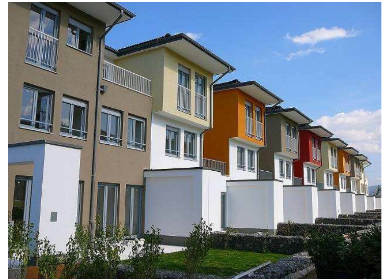
120 000 m 2 WDVS-Fassade Sofia Residential Park

In der Ausführung arbeitet Bautech GmbH mit Bautech Bull Construction zusammen. Mit dieser Organisationsform gewährleisten wir qualitative und kostengünstige Lösungen und Produkte.