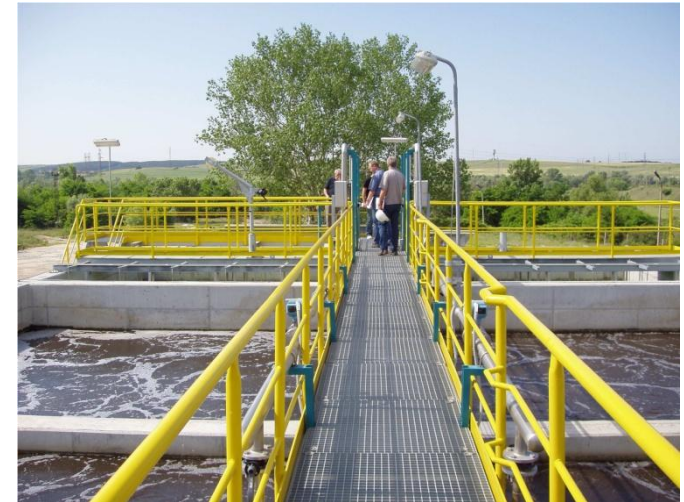
Kläranlage im Kraftwerk Maritza Iztok III