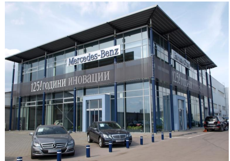
2- geschossiger Showroom mit Werkstatt, Mercedes-Benz Sofia